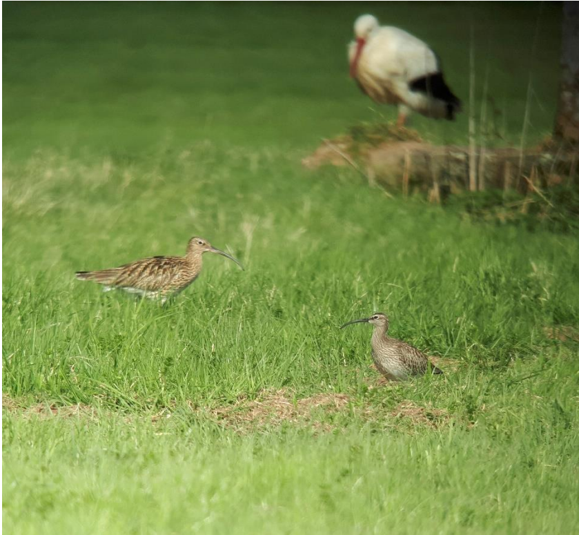
Abb. 5: Großer Brachvogel, Regenbrachvogel und Storch (oben) sowie Kampfläufer, Grünschenkel und Dunkelwasserläufer (unten) profitieren von der Wiesenwässerung. Der Lebensraum birgt viel Futter für Jungvögel während der Brutzeit oder zum Auffüllen der Fettdepots während des Zugs.