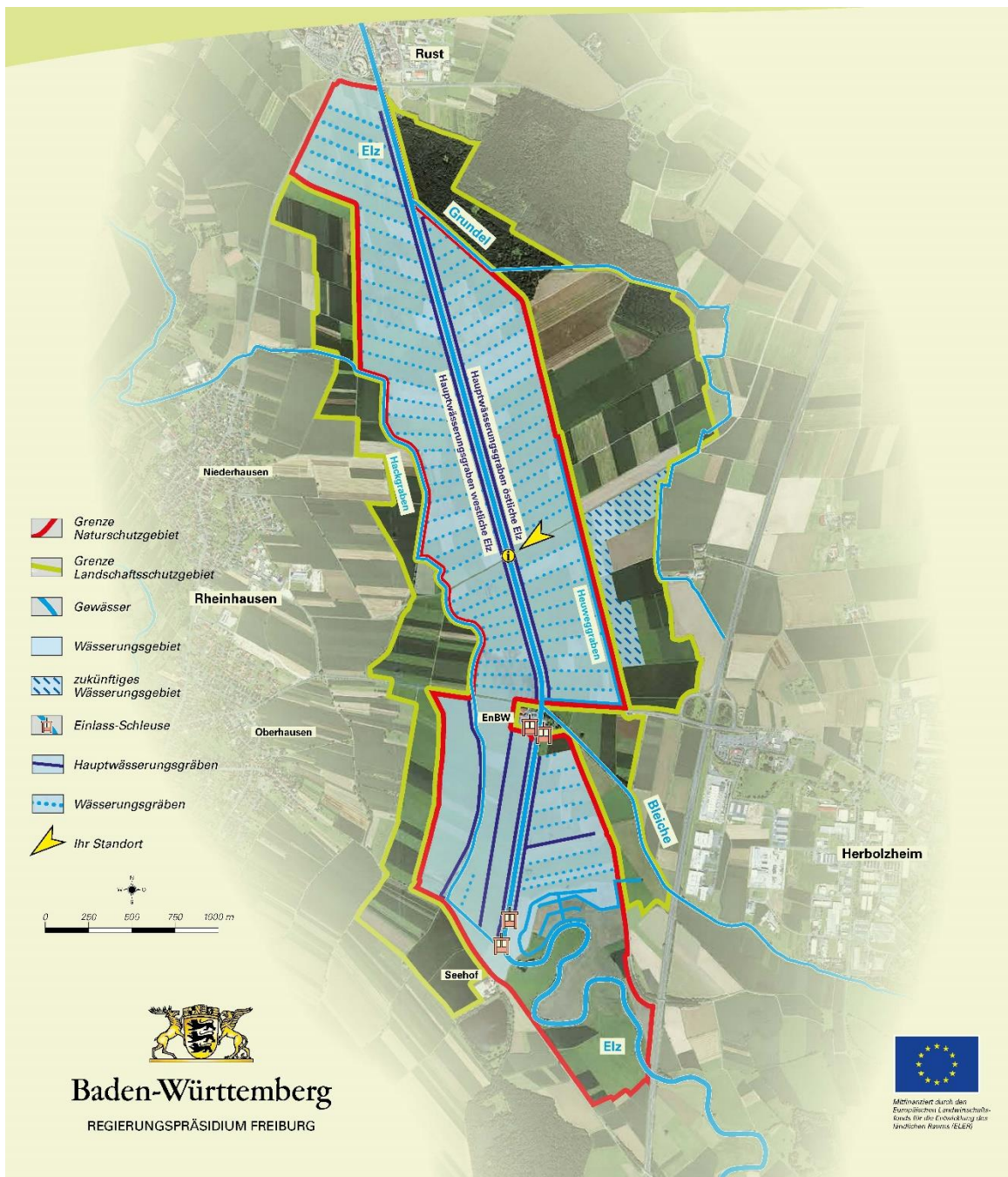
Abb. 1: Übersichtskarte der Elzwiesen.

terungsgebiet im Vogelzug, wie zum Beispiel für Watvögel. Dies ist in der Schutzgebietskulisse manifestiert: Die Elzwiesen sind als Naturschutzgebiet ausgewiesen und Teil des FFH-Gebiets „Taubergießen, Elz und Etenbach“ beziehungsweise des Vogelschutzgebiets „Elzniederung zwischen Kenzingen und Rust“ sowie Teil des grenzüberschreitenden Ramsar-Gebiets „Oberrhein“ (siehe Abb. 1).