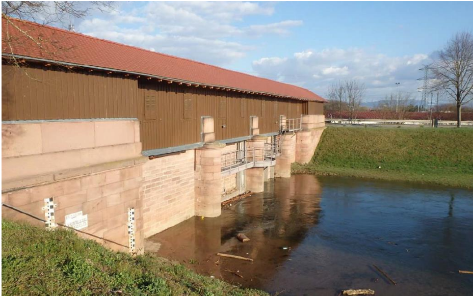
Abb. 2: Pumpwerksteg in der Alten Elz in der Gemeinde Riegel.

den Pegel in der Alten Elz und damit die Abflussaufteilung zwischen Leopoldskanal und Alte Elz. Am Pumpwerksteg befindet sich ein Hochwasser-Vorhersage-Pegel für die Alte Elz, welcher über www.hvz.baden-wuerttemberg.de abrufbar ist. Vor und während der Wässerung informieren sich die Wässerwarte online über den Pegelstand der Elz und den Grundwasserpegel sowie beim Landesbetrieb Gewässer.