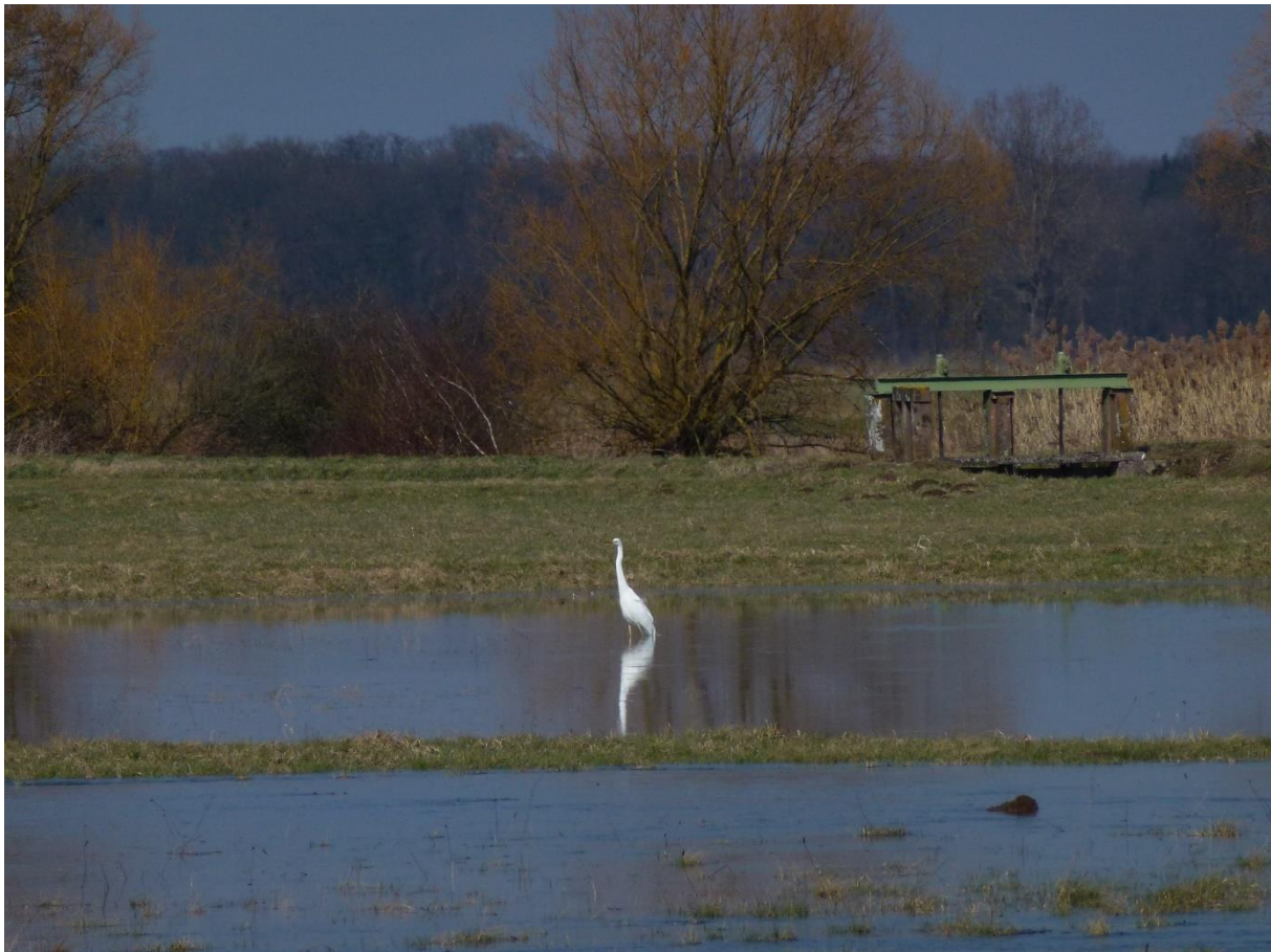
Abb. 4: Ein Silberreiher steht in einer überrieselten Wiese.

Ähnlich erfolgt die Wässerung der Wässerungsgenossenschaft Kenzingen für den Bereich innerhalb des Naturschutzgebiets Elzwiesen. Außerhalb des Naturschutzgebiets sind die Wiesenflächen vielfach durch Ackerflächen, teilweise auch durch Sonderkulturen unterbrochen, so dass nur noch Teile des Gebiets im Rahmen der Frühjahrsbewässerung traditionell gewässert werden können. Zu den übrigen Zeiten erfolgt nur noch eine Beschickung der Gräben ohne Überstauung der Flächen sowie die Einleitung von Wässerungswasser in das Naturschutzgebiet „Johanniterwald“. Ein Teilstrang des Wässerungsgebiets kann aufgrund von Siedlungsentwicklung nicht mehr betrieben werden.