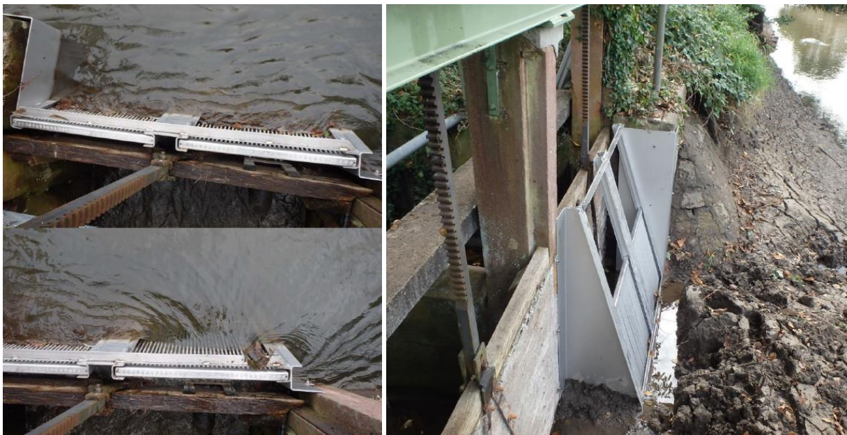
Abb. 6: Der Fischrechen wird an ein bestehendes Wehr montiert (rechts) und muss regelmäßig gereinigt werden, damit Wasser in die Gräben fließen kann (links - oben verstopft, unten gereinigt).

fest, dass die Rechen innerhalb weniger Minuten durch Laub verstopfen, wenn die Alte Elz Treibsel mit sich führte. Die manuelle Reinigung durch Wasserwarte war zeitlich nicht umsetzbar. Zur Reinigung der Rechen werden daher automatische Rechenreinigungsanlagen installiert, die alle 10 - 15 min den Rechenquerschnitt reinigen und das Laub in den Graben abziehen. Aufgrund des fehlenden Stromanschlusses wurden die Anlagen durch Batterien betrieben, teilweise kann ein Stromanschluss nun nachgerüstet werden. Über Solarmodule können die Rechenreiniger nicht betrieben werden, da sie auch nachts funktionieren müssen. Der Fischrechen inklusive des Einbaus und der Reinigungsanlage beläuft sich je nach Größe des Ausleistungsbauwerks auf circa 40.000 – 60.000 €.