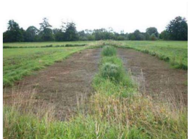
Abb. 7: Die Flutmulden auf Gemarkung Niederhausen und Rust können innerhalb weniger Wochen austrocknen.