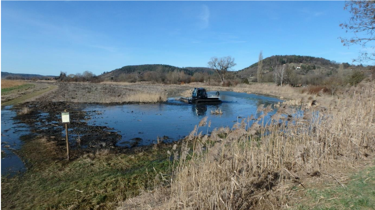
Abb. 2: Einsatz einer Pistenraupe beim "Blänkenschieben".