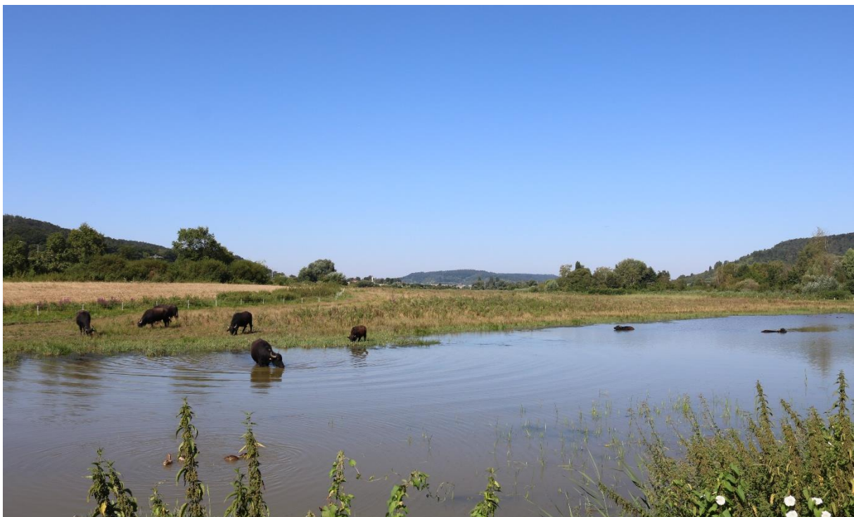
Abb. 3: Wasserbüffel grasen und kühlen sich in einer Blänke ab.

gelmäßig zurückgeschnitten, da der Kiebitz auf gehölzfreie Feldfluren angewiesen ist. Wiesenbrüter wie der Kiebitz geben zudem ihr Gelege bei zu viel Unruhe auf. Daher wurden die vor der Wiedervernässung zugänglichen Wege gesperrt. Ein Schild informiert Besucherinnen und Besucher über die Maßnahme.