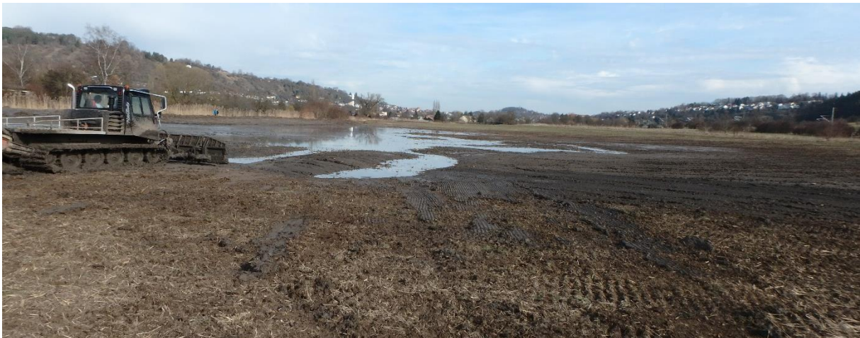
Abb. 1: Senkenstruktur beim "Blänkenschieben".

Vogelschutzgebiet „Schönbuch“, welches unter anderem wegen des Kiebitz ausgewiesen wurde. Nachdem das letzte lokale Vorkommen in Folge von genehmigten, landwirtschaftlichen Entwässerungsmaßnahmen zerstört wurde, bestand Handlungsbedarf. Das Regierungspräsidium (RP) Tübingen initiierte daraufhin die Maßnahme zur Wiedervernässung. Übergeordnetes Ziel ist die Wiederansiedelung des landesweit vom Aussterben bedrohten Kiebitz. Der Kiebitz ist eine Schirmart: Schutzmaßnahmen für den Kiebitz haben somit positive Auswirkungen auf viele weitere Arten.