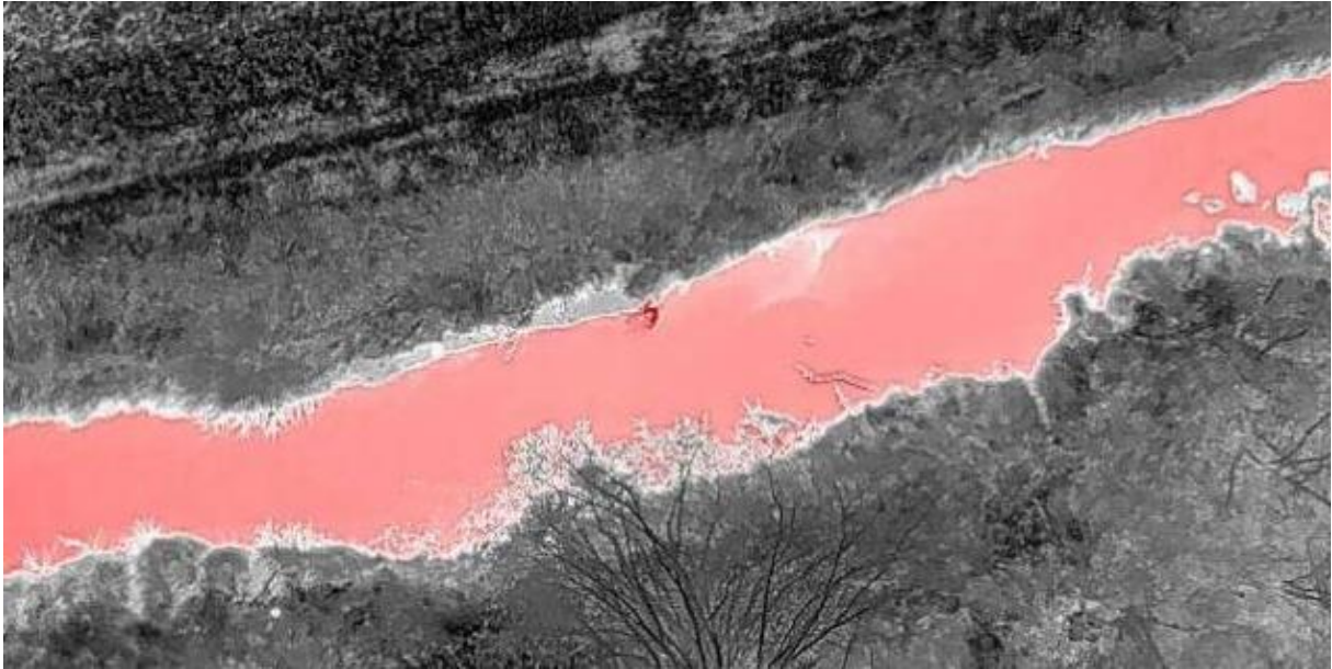
Abb. 5: Die detektierte Drainage ist durch die dunkelrote Verwirbelung in der Ammer (hellrot) zu erkennen.