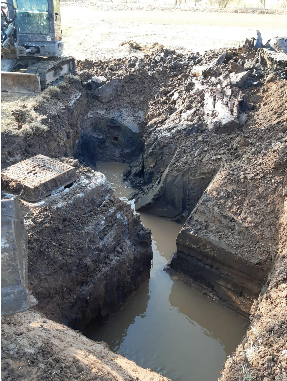
Abb. 8: Trennen und Verplomben des Drainagesammlers.

gräbt einen Suchschlitz (siehe Abb. 8). Ist das Rohr gefunden, wird es gekappt, verplombt und der Graben wieder mit dem Aushub gefüllt und verdichtet.