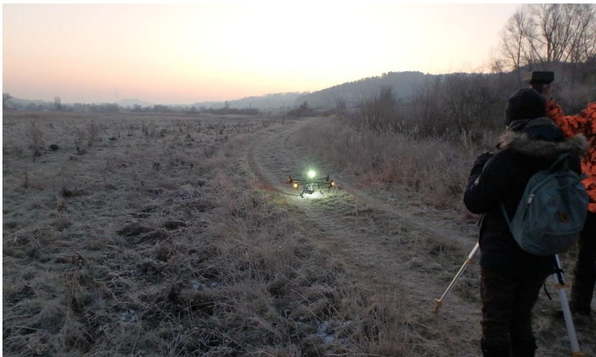
Abb. 4: Start der Detektor-Drohne.

www.waesserwiesen.dvl.org/veranstaltungen/webinarunterlagen