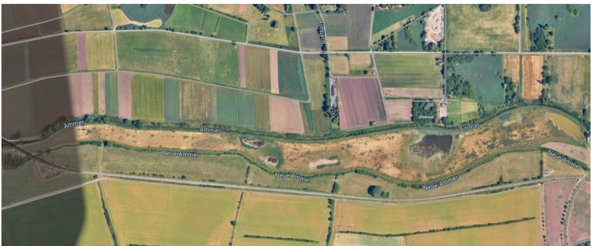
Abb. 6: Das beflogene Gebiet wird nördlich von der Ammer und südlich von der Neuen Ammer (dem Ammerkanal) begrenzt.